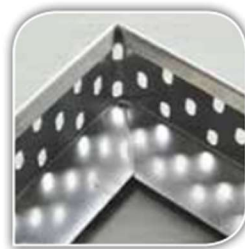
1. Het maken van hoeken